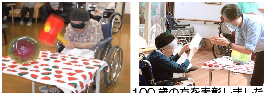
100歳の方を表彰しました